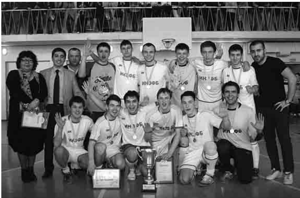
В Башгосуниверситете работают 26 спортивных секций

Свои собственные студенческие СМИ существуют также на многих факультетах. Например, в институте права выходит газета «Перспектива», в институте экономики, финансов и бизнеса – журнал «ЭкономIX». На филологическом факультете издают газету «Слово», а студенты факультета башкирской филологии и журналистики выпускают сразу несколько изданий: электронную газету «Наша газета», печатные «Ре-Пост» и «На острие пера» (на русском языке), «Ауаз» (на башкирском языке).