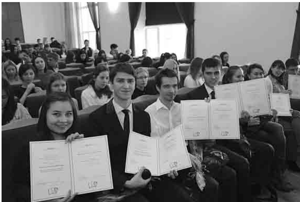
Среди студентов, магистрантов и аспирантов БашГУ много обладателей именных стипендий

В университете работают 26 спортивных секций. Среди них секции по бадминтону, баскетболу, боксу, борьбе «Курэш», волейболу, дзюдо, кикбоксингу, лапте, мини-футболу, настольному теннису, пауэрлифтингу, гиревому спорту, зимнему полиатлону, плаванию, самбо, спортивному ориентированию, пулевой стрельбе, шахматам и шашкам. Любителей туризма ждут в туристическом клубе «Восхождение».