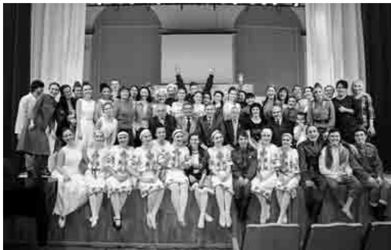
Ежегодно в БашГУ проходит масса студенческих праздников

участвуют в работе межвузовских и внутриуниверситетских конференций, круглых столов, олимпиад, конкурсов и других научных мероприятий.