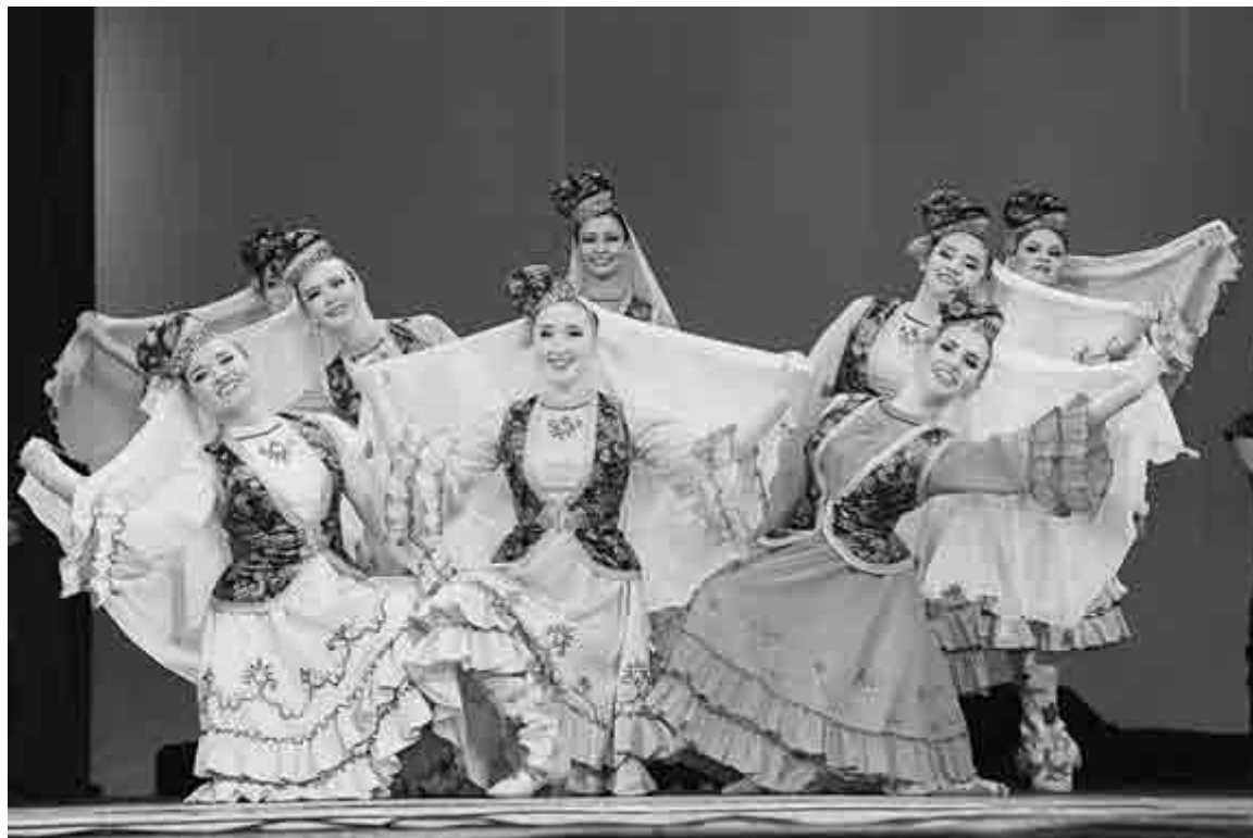
В творческих коллективах БашГУ можно научиться песенному, танцевальному, актёрскому мастерству и многому другому

В БашГУ есть собственный спортивный комплекс и лыжная база, несколько открытых спортивных площадок и даже летний спортивно-оздоровительный лагерь «Нагаево».